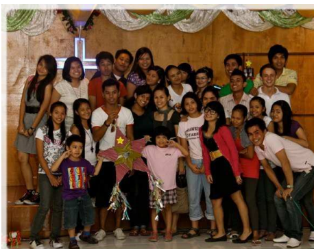
Jugendliche in meiner Gemeinde