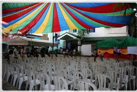
Evangelisation am 17'ten Geburtstag meiner Gemeinde