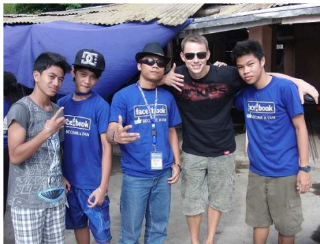
Jugendliche aus Soldiers Village und Parola

Zwischendurch Spiele, Filmshowing, Praise and Worship u.v.m. Viele Leute kannte man schon von verschiedenen Jugendgottesdiensten, aber auch habe ich viele neue Leute kennen gelernt. Gemeinsam mit meinen Shortykollegen habe ich bei den Vorbereitungen der Spiele mitgeholfen. Auch war ich mal wieder da wo Not am Mann war, oder wie wir das hier so schön nennen " Lack of Man" =).