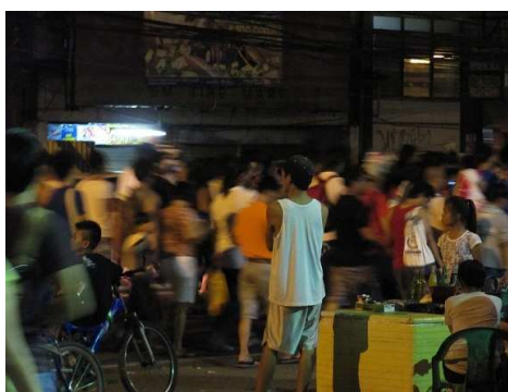
Pilger auf dem Weg nach Antipolo

Gründonnerstag sind wir auf den Ortigas (einer der wichtigsten Straßen) gegangen, wo Millionen von Pilger waren. Viele dieser Pilger nehmen mehr als 25 km auf sich um zu einer alten katholischen Kirche in Antipolo zu gehen. Da wir ziemlich an der östlichen Metropolgrenze leben, sind die Antipolohügel nicht weit entfernt.