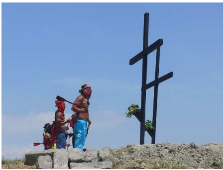
Vor der Kreuzigung