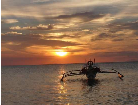
Die schöne Seite von den Philippinen

Ich freue mich natürlich auch über Emails, Briefe, Karten, Skypen, Päckchen u.v.m. =)