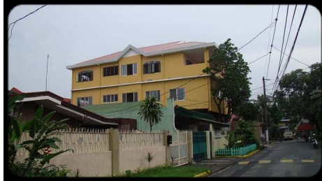
Das AM-Haus in der Nara Street

was für eine gute Zeit es ist. Gerade beim ersten gemeinsamen Bibellesen waren wir sehr offen und haben sehr gute Gespräche gehabt.