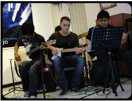
Nicht an den Drums sondern an der Gitarre =)