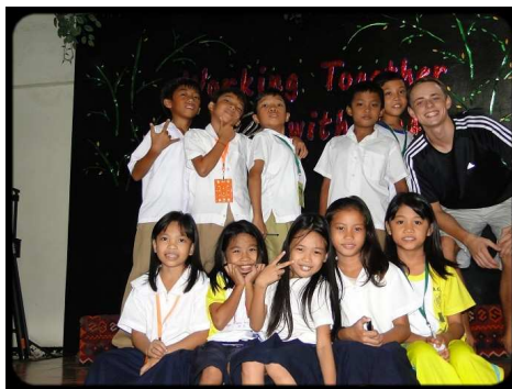
Eine Klasse im STC

Für ihn ist es ein Segen, weil er, auch wenn er seit neustem ein Bibelschulstudent ist, nicht so oft die Bibel liest und viele Dinge als wichtiger ansieht und er auch keinen hat, der sich intensiv mit ihm beschäftigt. Für ihn ist es ein echter Segen, dass wir gemeinsam reden, Bibel lesen und miteinander beten, was mir bestätigt, dass es Gottes Wille war, dass ich ihn fragen sollte. Bin für diese Beziehung sehr dankbar, dass das Jesus geschenkt hat.